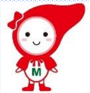
肝疾患相談センターマスコットキャラクター「へぱちゃん」